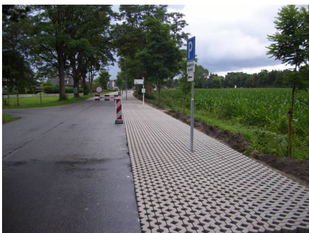
Grasbetontegels als duurzame verharding van bermen