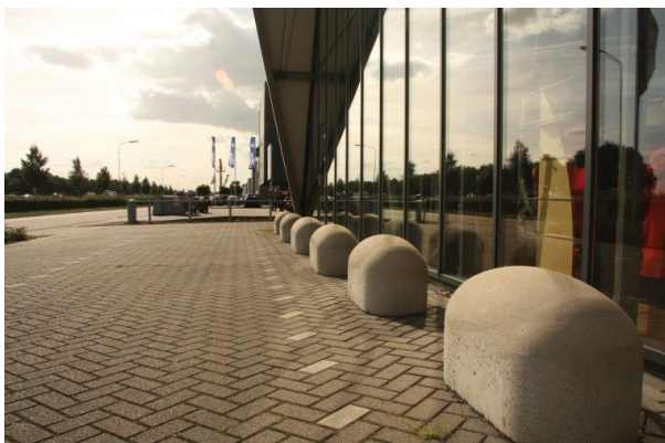
Jumboblokken als anti-kraakelementen