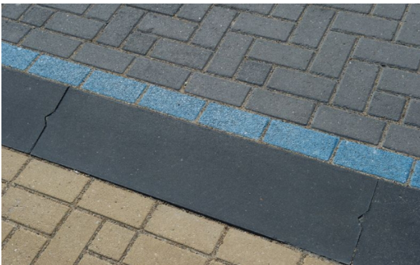
PWS-banden in het dorpshart van Callantsog