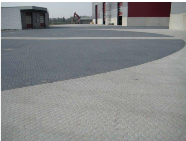
Van Voorden te Zaltbommel (1)